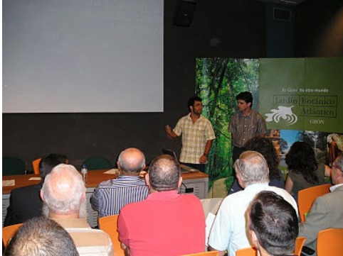
Un instante de las charlas sobre polinizadores del JBA